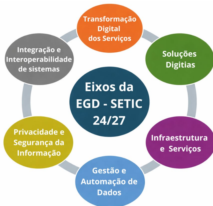
Figura 1 - Eixos da Transformação Digital - Setic 24/27

Para alcançar todas as áreas de atuação da SETIC, bem como os objetivos específicos estabelecidos da Estratégia de Governo Digital 2024-2027, instituída pela Portaria nº 46 de 11 de abril de 2024, o presente plano observará os 06 (seis) eixos temáticos estruturantes: