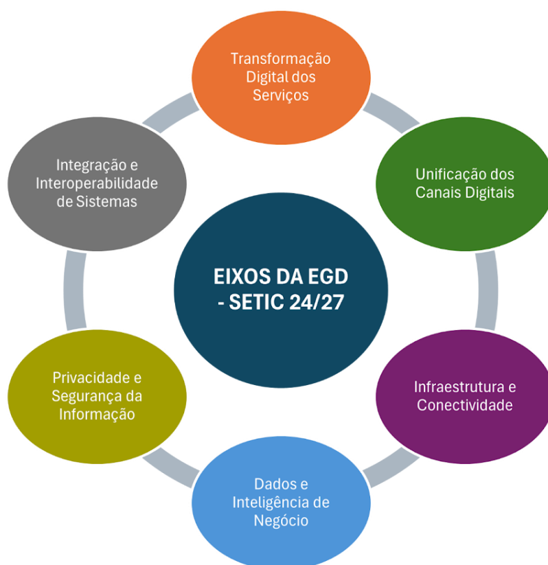
Figura 1 - Eixos da Transformação Digital - SETIC 24/27

A divisão por eixos viabiliza uma administração de riscos mais eficiente, possibilita uma implementação ágil e simplifica a avaliação do avanço em cada área específica, o que permite ajustes contínuos na estratégia conforme os resultados alcançados para “promover a transformação dos serviços públicos, com ênfase na satisfação do cidadão, por meio da implementação de práticas inovadoras, soluções digitais e parcerias estratégicas, aprimorando a experiência do cidadão no uso dos serviços públicos e sua satisfação” (EGD/SETIC, 2024, pág. 22).